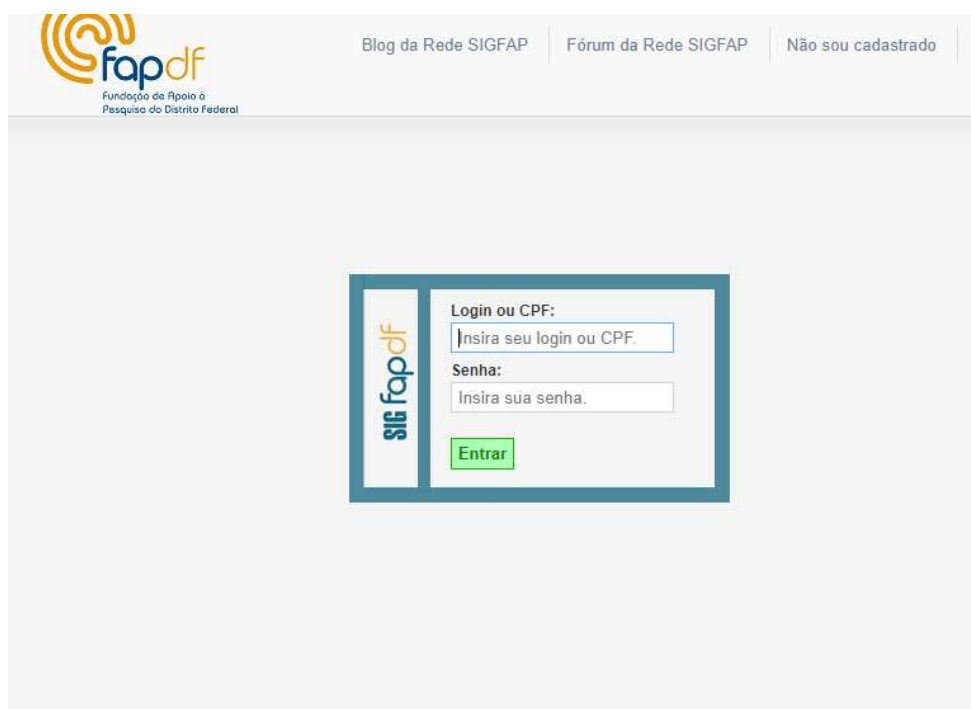
01- Página de login.