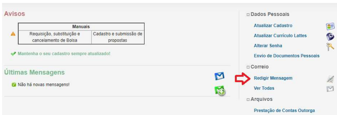
02- Página principal do SIGFAP.