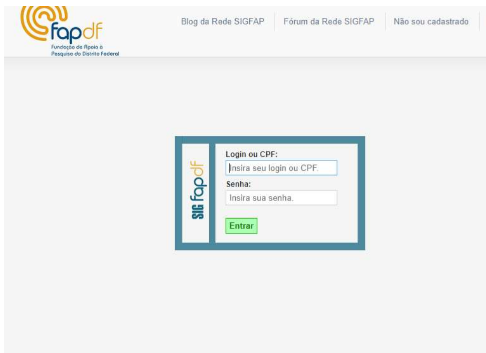
01- Página de login.